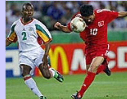
WM Live Kamerun-Türkei